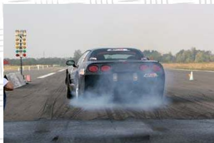
Quest'anno è stata riservata una categoria speciale alle Supercar.

piloti ha capito che Nitro Drag è la loro casa e da quest'anno si occuperanno anche del regolare funzionamento dei paddock, accompagnando all'uscita i partecipanti scorretti. Inoltre gli eventuali contestatori non dovranno più rivolgersi al sottoscritto ma all'Associazione. Tornando nel vivo delle gare, la novità dello scorso anno è stata la Lancia Delta dei romani, prima sport compact italiana a scendere sotto i 10 secondi senza NOS, ma anche la 106 di Resa ha stabilito un record: 11,3 sec con una trazione anteriore, anche in questo caso senza NOS! Una gara che ha lasciato l'amaro in bocca invece è stata quella di Misano, pietra tombale della Bravo di Baby-Go by