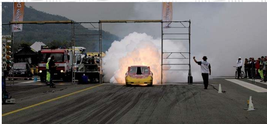
Fuoco e fiamme... ma sempre sotto perfetto controllo.