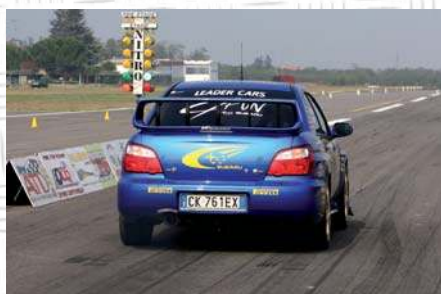
Stradali assatanate al Nitroday.