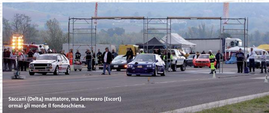
Saccani (Delta) mattatore, ma Semeraro (Escort) ormai gli morde il fondoschiena.