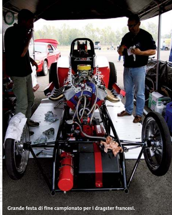
Grande festa di fine campionato per i dragster francesi.