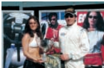
DIDA DIDA DIDA DIDAA

E la CSAI?... Buone notizie ragazzi! Finalmente ci stanno dando l'importanza che meritiamo: ad ogni nostra gara stanno intervenendo inviati CSAI molto importanti, che osservano e valutano le tanto attese modifiche al regolamento, e a quanto pare apprezzano i nostri sforzi e le nostre ragioni; quindi nei prossimi giorni in pentola ci sarà il nuovo regolamento tecnico, che consentirà finalmente di inquadrare le vetture della nostra specialità in una classificazione dedicata, al di fuori dei canoni classici (Gruppi N, A ecc.) e dentro ai regolamenti internazionali F.I.A.